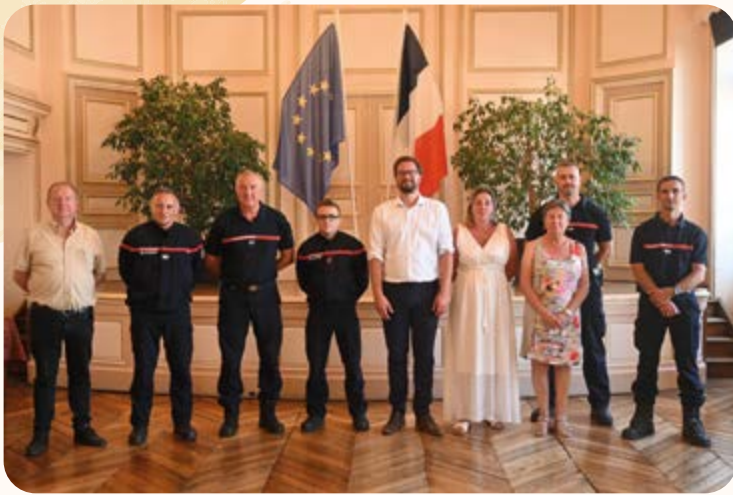
◀ Présentation des Olympiades du CTIF par les sapeurs-pompiers de Péronne