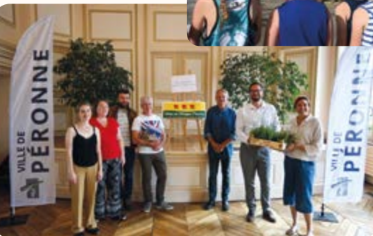
Passage du jury du label des villes fleuries