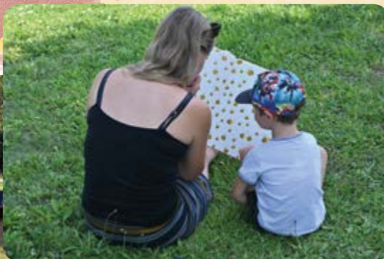
Spectacle Nice to Five