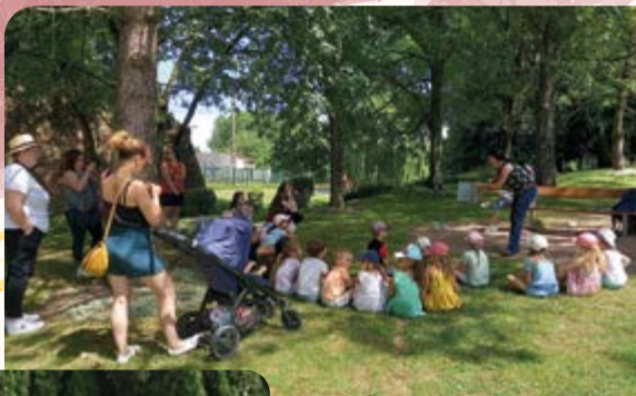
Contes en balade par la bibliotheque municipale ▶