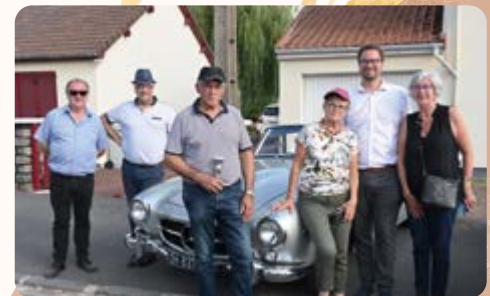
Exposition de voitures anciennes