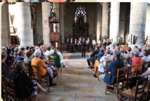
Concert du chœur de chambre Septentrion ▶