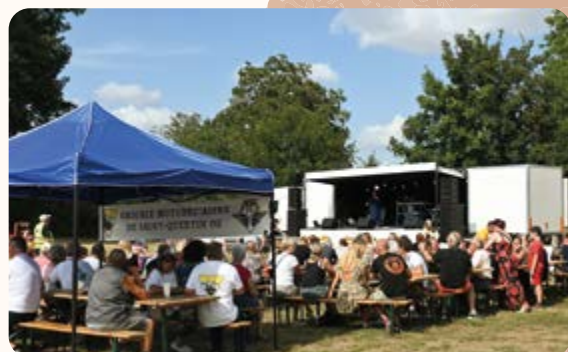
◀ Animations du 15Août