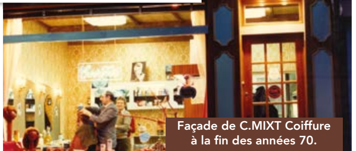
Façade de C.MIXT Coiffure à la fin des années 70.