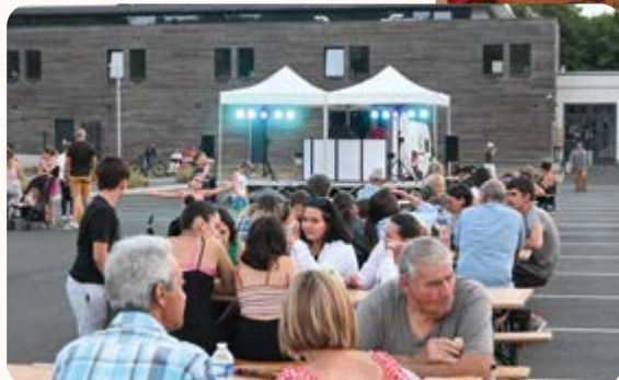
▲ Soirée DJ