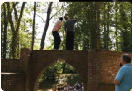
▲ Balade circographique avec la CIE Circographie