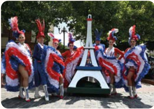
◀ Animations du 14 juillet